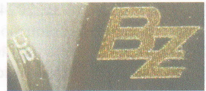
Зображення 5. Збільшене зображення маркувальних позначень на клинку ножа.

Руків'я виготовлено з металу світло-сірого кольору яке притягується магнітом. Між плашками (в руків'ї) є отвір в який клинок складається в похідне положення. До руків'я кріпляться плашки (з кожної сторони по одній) з твердого матеріалу чорного кольору за допомогою трьох гвинтів (з кожної сторони по три). Довжина руків'я 95мм, найбільша ширина 21мм, найбільша товщина 11мм. З одної сторони до руків'я за допомогою двох гвинтів кріпиться металева скоба виготовлена з металу сірого кольору, яка призначена для кріплення ножа на ремені. На руків'ї будь які маркування відсутні (на зобр. 3, 4).