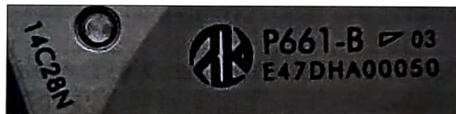
Зображення 3,4. Маркувальні позначення.

Характер виконання досліджуваного ножа свідчить про промисловий спосіб його виготовлення.