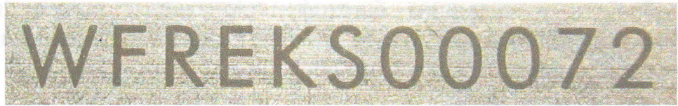
Зображення 8. Збільшене зображення маркування на руків'ї ножа наданого на дослідження.

Руків'я виготовлено з металу сірого кольору яке притягується магнітом. Довжина руків'я 110мм, найбільша ширина 21мм, найбільша товщина 26мм. До руків'я з обох сторін кріпляться плашки чорного кольору за допомогою трьох гвинтів (з кожної сторони по три). Плашки мають рифлену структуру. З одної сторони до плашки кріпиться металева скоба сірого кольору за допомогою двох гвинтів. На обусі руків'я є маркування у вигляді літер та цифр «WFREKS00072» (на зобр. 8).