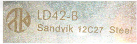
Зображення 5. Збільшений вигляд маркувань на клинку ножа.

Довжина клинка пилки яка знаходиться після клинка ножа 93мм, найбільша ширина клинка пилки 12мм, найбільша товщина клинка пилки 1мм. Клинок пилки виготовлений з металу сірого кольору, прямої форми, що притягується магнітом та має зубці різної висоти пірамідальної форми. Спосіб з'єднання клинка пилки з руків'ям шарнірний, за допомогою фіксатора. Будь які маркування на клинку пилки відсутні (на зобр. 6, 7).