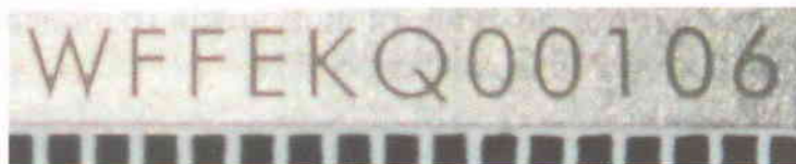
Зображення 8. Збільшене зображення маркування на руків'ї ножа наданого на дослідження.

Руків'я виготовлено з металу сірого кольору яке притягується магнітом. Довжина руків'я 114мм, найбільша ширина 21мм, найбільша товщина 23,5мм. До руків'я з обох сторін кріпляться плашки чорного кольору за допомогою трьох гвинтів. Плашки мають рифлену структуру. З одної сторони до плашки кріпиться металева скоба сірого кольору за допомогою двох гвинтів. На обусі руків'я є маркування у вигляді літер та цифр «WFFEKQ00106» (на зобр. 8).