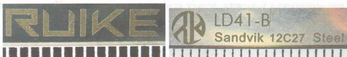
Зображення 5. Збільшений вигляд маркувань на клинку ножа.

Зображення 3, 4. Загальний вигляд ножа в бойовому положенні з обох сторін.