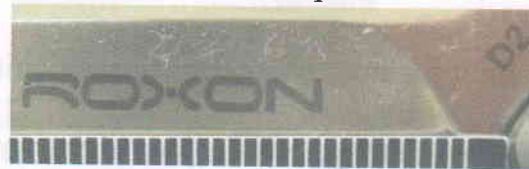
Зображення 5. Збільшене зображення маркувальних позначень на клинку.

Зображення 3, 4. Загальний вигляд ножа в бойовому положенні з однієї та іншої сторони.