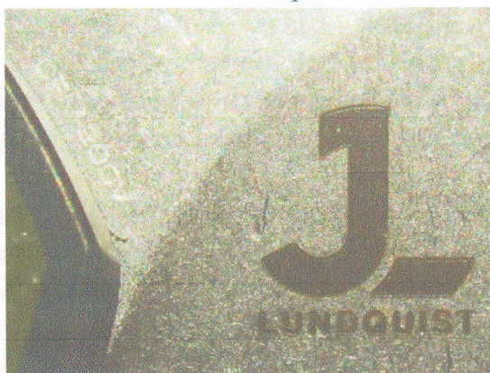
Зображення 5. Збільшене зображення маркувальних позначень на клинку ножа.

Зображення 3, 4. Загальний вигляд ножа в бойовому положенні з однієї та іншої сторони.