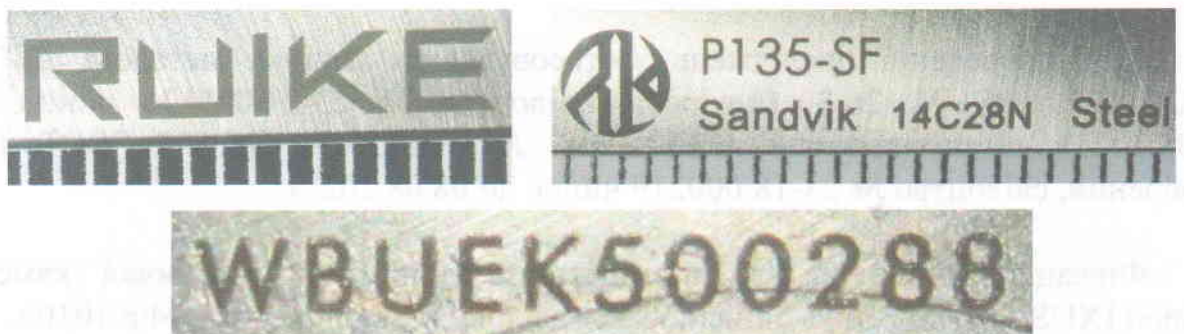
Зображення 5. Збільшене зображення маркувальних позначень на клинку.

Зображення 3, 4. Загальний вигляд ножа в бойовому положенні з одної та іншої сторони.