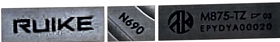
Зображення 3-5. Маркувальні позначення.

Характер виконання досліджуваного ножа свідчить про промисловий спосіб його виготовлення.