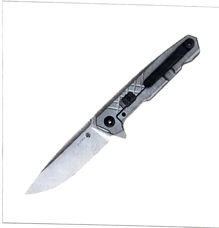
Зображення 6. Інтернет-джерело порівняльного зразку наданого ножа: https://ruike.com.ua/nozh-skladnoy-ruike-m875-tz/

побутового призначення, наданих в спеціальній криміналістичній, довідковій літературі, відповідних каталогах, офіційних Інтернет-сайтах фірм-виробників та ін., а також з числа інформаційно-довідковій колекції сектору досліджень зброї ВКВД Харківського НДЕКЦ встановлено схожість порівнюваних розмірно-конструкційних характеристик наданого ножа з аналогічними параметричними даними складаних ножів ф. «Ruike» моделі «M875-TZ» (див. зображення 6):