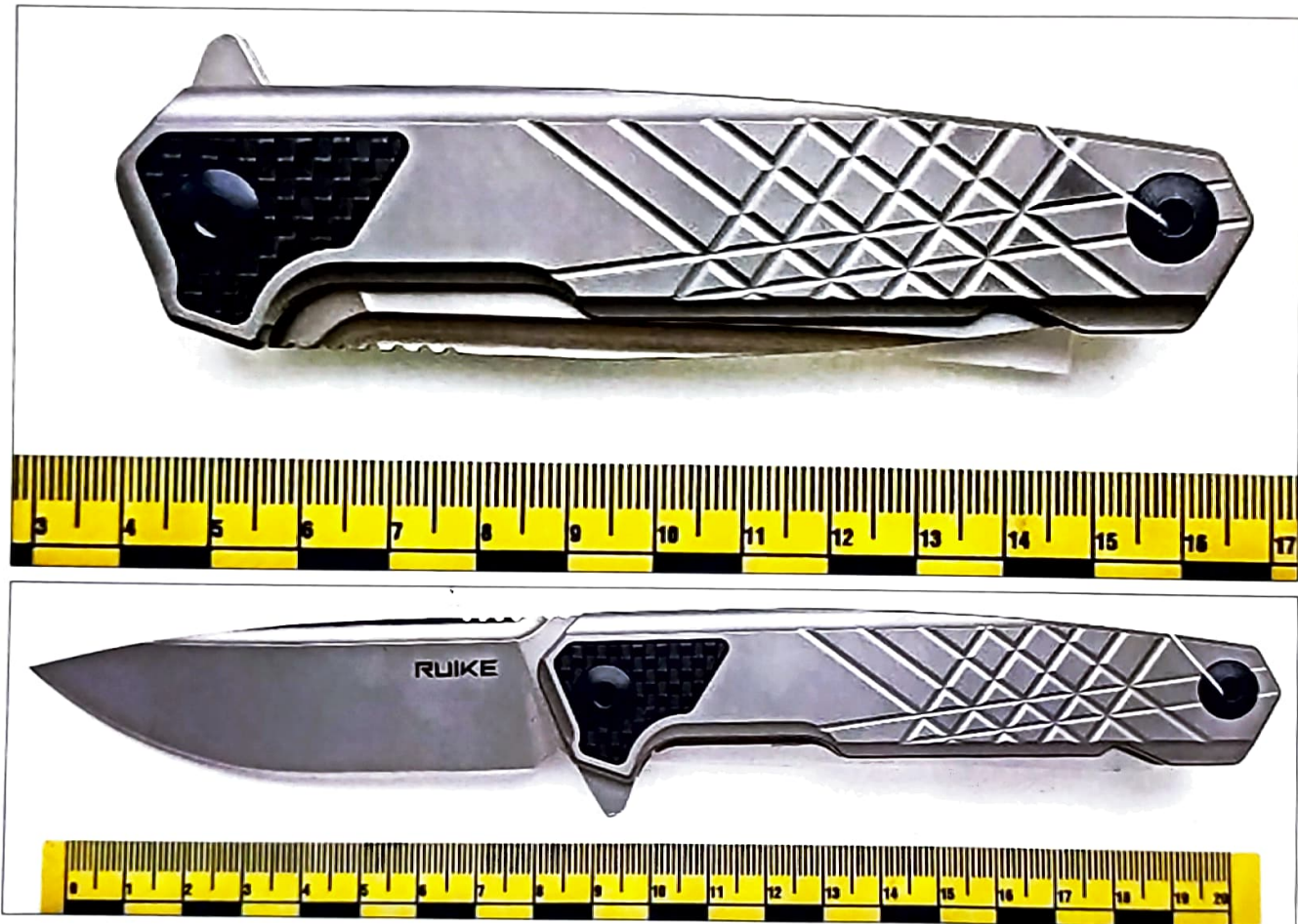
Зображення 1.2. Наданий на дослідження ніж у складеному та розкладеному стані.

Наданий на дослідження складаний ніж складається з клинка, руків'я та фіксатора (див. зображення 1,2).