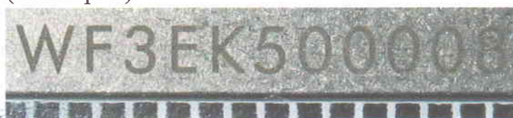
Зображення 6. Збільшене зображення маркувальних позначень на руків'ї ножа.

Руків'я виготовлено з металу сірого кольору до якого з обох сторін прикріплено плашки чорного кольору та з'єднано між собою за допомогою трьох гвинтів (з кожної сторони по три). Довжина руків'я 112мм, найбільша ширина 24мм, найбільша товщина 11мм. З одної сторони до руків'я за допомогою двох гвинтів кріпиться металева скоба виготовлена з металу сірого кольору, яка призначена для кріплення ножа на ремінь. В задній частині руків'я є бочкоподібний виступ, висотою 4мм та діаметром. В руків'ї (боковій його частині) є металевий предмет (пінцет) з наступними габаритними розмірами 4,5x1x67мм. На обусі руків'я є маркування у вигляді літер та цифр «WF3EK500008» (на зобр. 6).