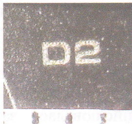
Зображення 5. Збільшене зображення маркувальних позначень на п'яті клинка ножа.

Зображення 3, 4. Загальний вигляд ножа в бойовому положенні з одної та іншої сторони.